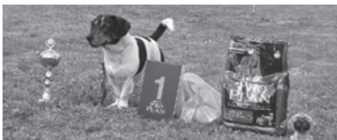
■ Vítěz 1. ročníku: kříženec Fajny